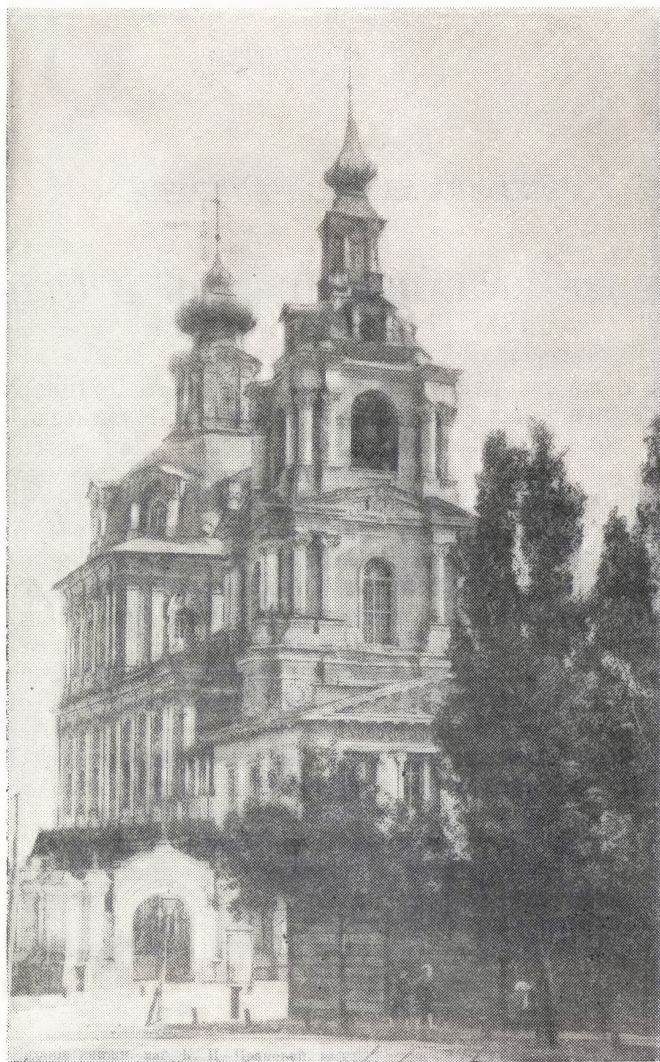
КУРСКИЙ КАФЕДРАЛЬНЫЙ СОБОР

чение лета работа была выполнена бесплатным трудом богомольцев собора. По призыву настоятеля храма, группы богомольцев собора работали, ради Господа, в течение этого лета над уборкой и очисткой площади, и к осени площадь была приведена в такое состояние, что весной 1948 г. представилась возможность устроить на ней цветник.